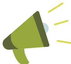
La libertad de expresión