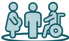
La reunión y asociación pacífica