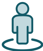
La integridad personal